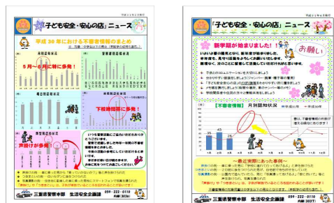
子ども安全・安心の店ニュースなど