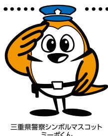
三重県警察シンボルマスコット ミーボくん